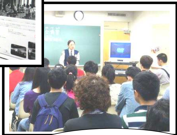
大型超級市場在本校舉辦 說明會與面試