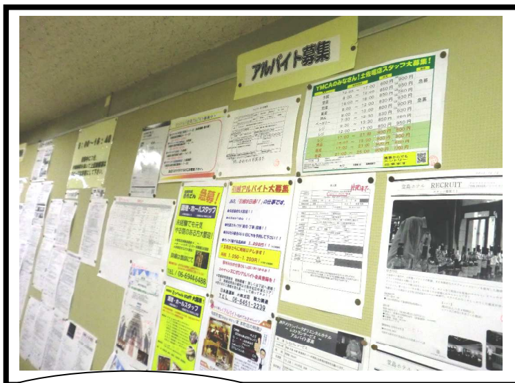
校內打工徵才資訊 公佈欄