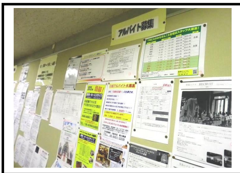
校內打工徵才資訊